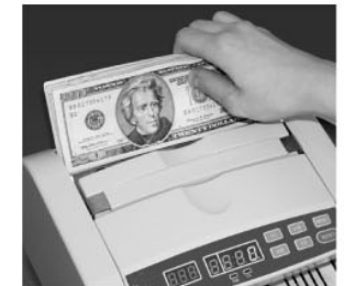
ПОМЕСТИТЬ ПАЧКУ В ЗАГРУЗОЧНЫЙ ОТСЕК