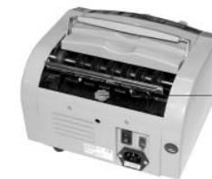
Винт регулировки зазора

Для регулирования пластины используйте винт регулировки зазора.