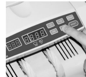
ВЫБРАТЬ СПОСОБ СЧЕТА