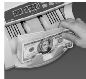
ИЗВЛЕЧЬ БАНКНОТЫ ИЗ ПРИЕМНОГО ОТСЕКА